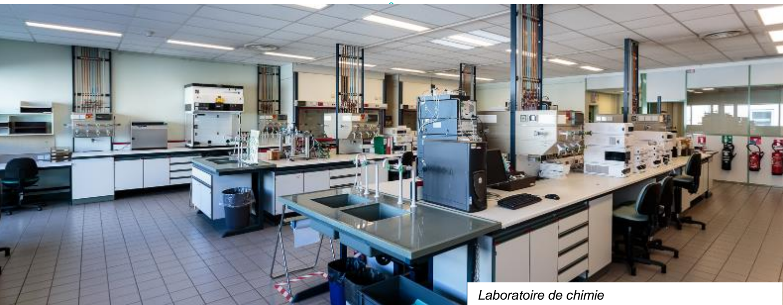
Laboratoire de chimie