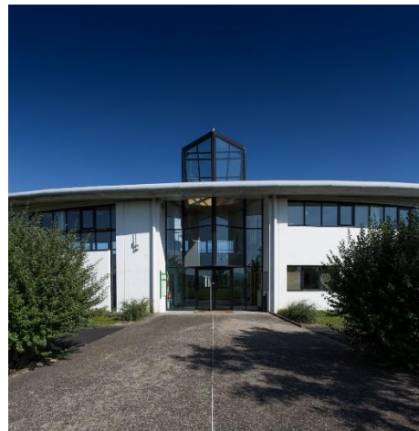
Le biopôle Clermont Limagne