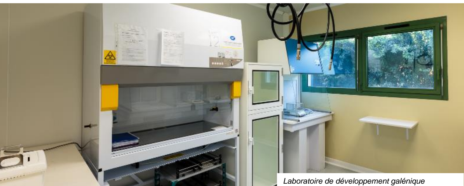
Laboratoire de développement galénique