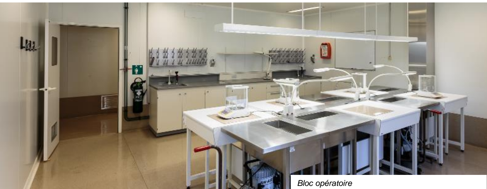
Bloc opératoire